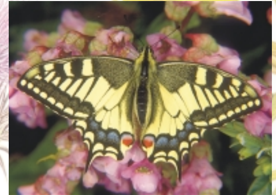
Schwalbenschwanz: Schmetterling des Jahres 2006